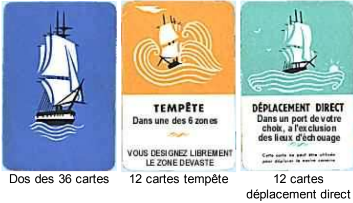
Dos des 36 cartes